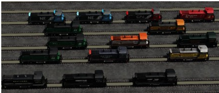
Schilderen kunnen ze als de beste in de USA

Het bouwen van routes, onderdelen, gebouwen of locomotieven met behulp van de diverse editors en heel veel puzzelen is aan mij niet besteed, maar je moet doen wat jezelf leuk vind.