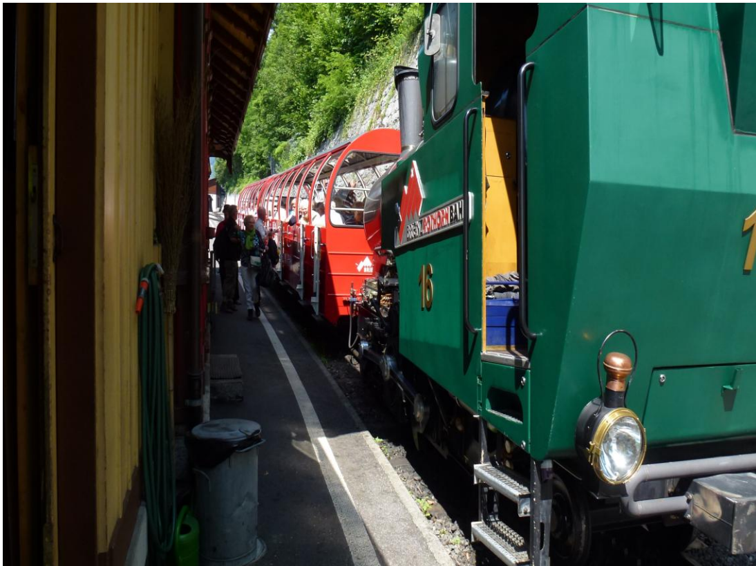
Een van de laatste stoomloc's van de Brienz Rothornbahn. (juni 2012)

Tijdens de vakantie in Zwitserland met moderne treinstellen prachtige trajecten gereden, maar ook een rit gemaakt naar de Rothorn met de Rothornbahn. 'Zwitsers speelgoed'