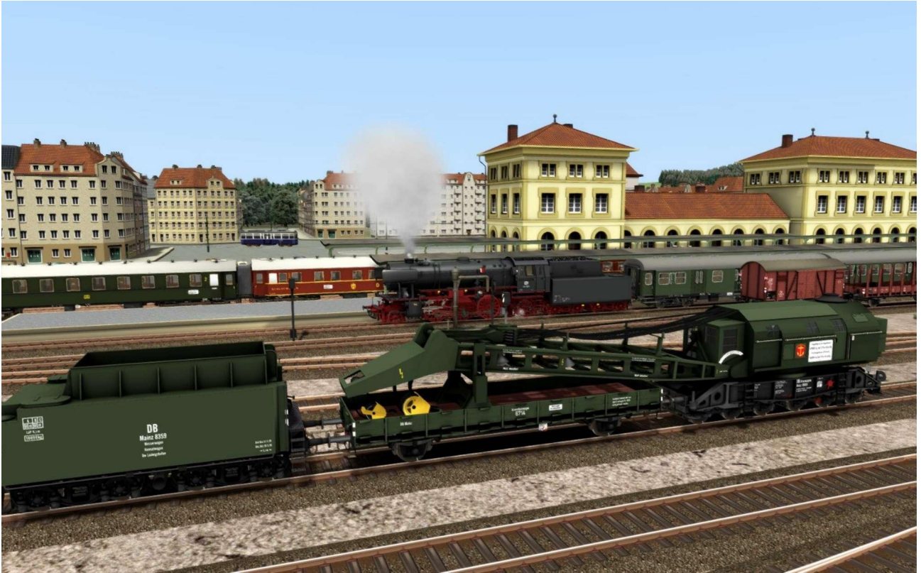
De ongevallentrein heeft een eigen spoor ('EDK-Zug') en kan in scenario's worden ingezet.