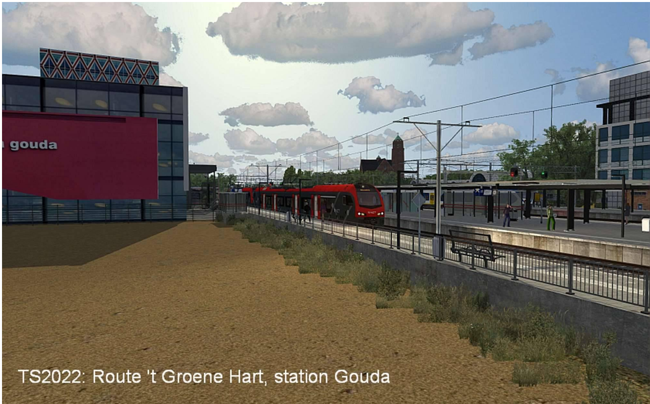
TS2022: Route 't Groene Hart, station Gouda

Allereerst aandacht voor een nieuwe route: 't Groene Hart versie 1.0 . Het betreft de virtuele weergave van het traject Alphen aan de Rijn – Gouda. Het traject is in de reële wereld 17,6 kilometer lang, heeft in totaal 7 stations en is beveiligd met ATB EG. In de spits rijdt er op dit traject elk kwartier een trein daarbuiten is het om het half uur. De bouw van dit traject is in 1926 begonnen maar is uiteindelijk pas op 7 oktober 1934 geopend. De treindienst wordt onder de vlag van R-net uitgevoerd door Abellio (een merk van de NS), en er rijden tweedelige treinstellen van het type FLIRT-3.