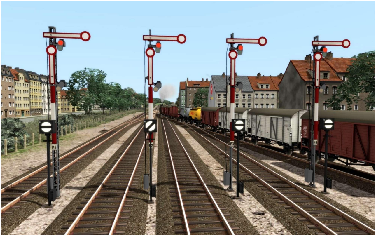
De uitrijseinen aan de westzijde van het emplacement.