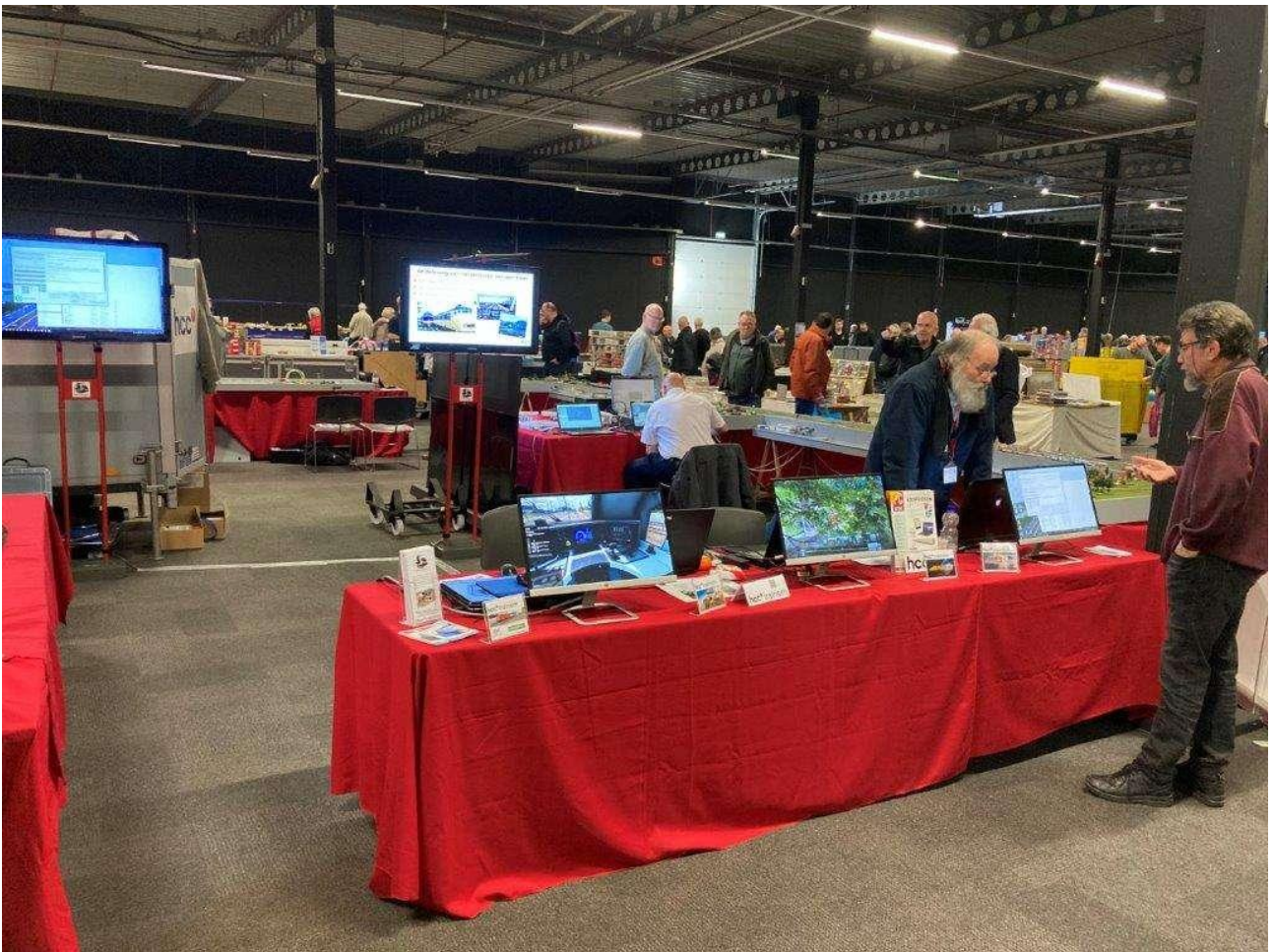
een blik op onze stand bij Houten op Rails op 10 en 11 feb 2023