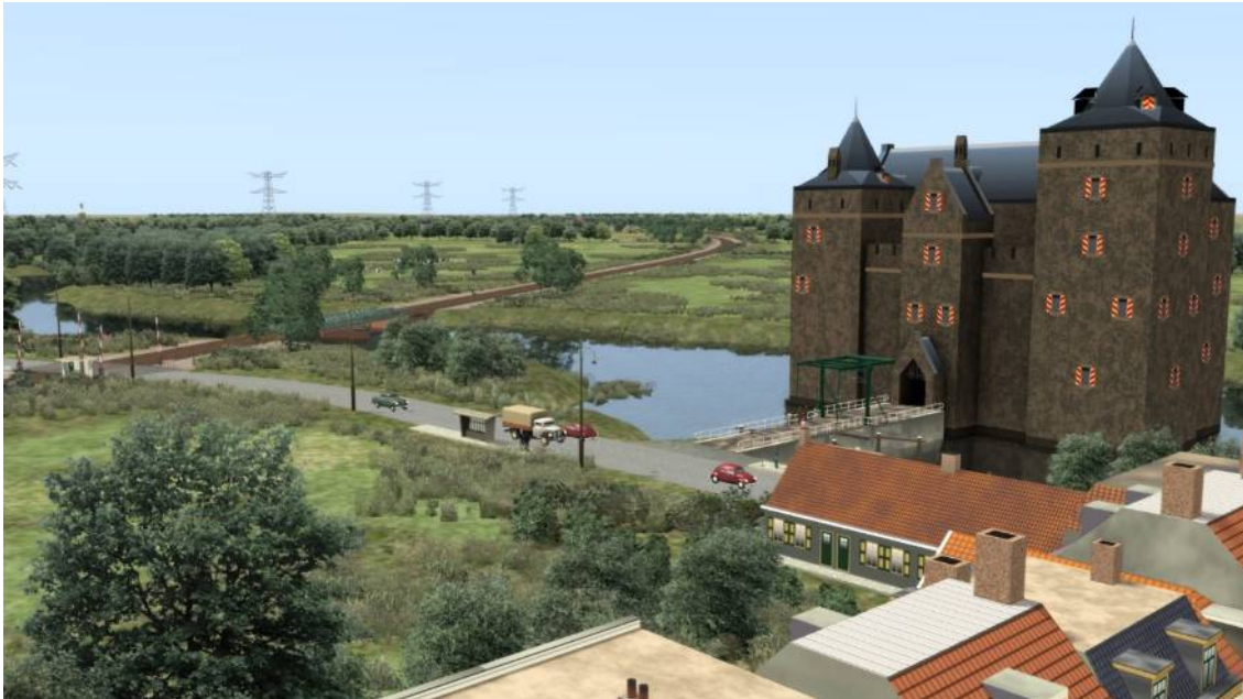
Het tracé van de VSTS voert langs een gerestaureerd monument uit de middeleeuwen.

baar mag zijn. Deze optische truc werkt uiteraard niet voor routes in meer heuvelachtige streken of de Alpen, zoals de Semmeringroute. Dan wordt een routebouwer geconfronteerd met omvangrijke hellingen die moeten 'gestoffeerd'.