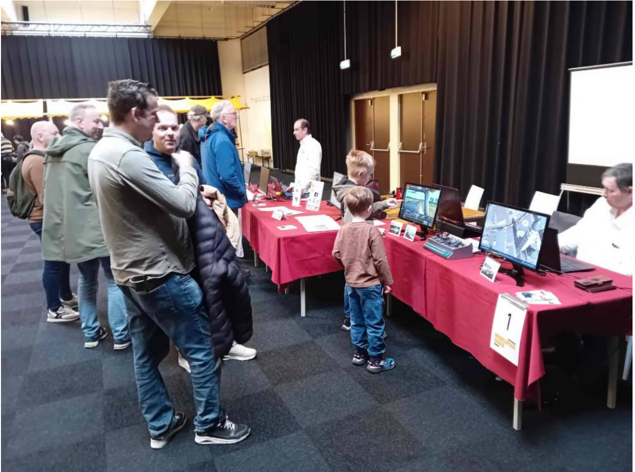
Onze stand bij de Nederlandse Modelspoordagen in Rijswijk

Wij hebben intussen ook in het land onze hobby mogen promoten om nieuwe leden te werven. Zo waren wij te gast bij de Modelspoorbeurs Plus in Houten, Noord Hollandse Modelspoordagen in Alkmaar en de Nederlandse Modelspoordagen in Rijswijk. We hebben veel aanloop gehad met specifieke vragen over de trainsim softwarepakketten en ook de Raildriver stond weer in de belangstelling.