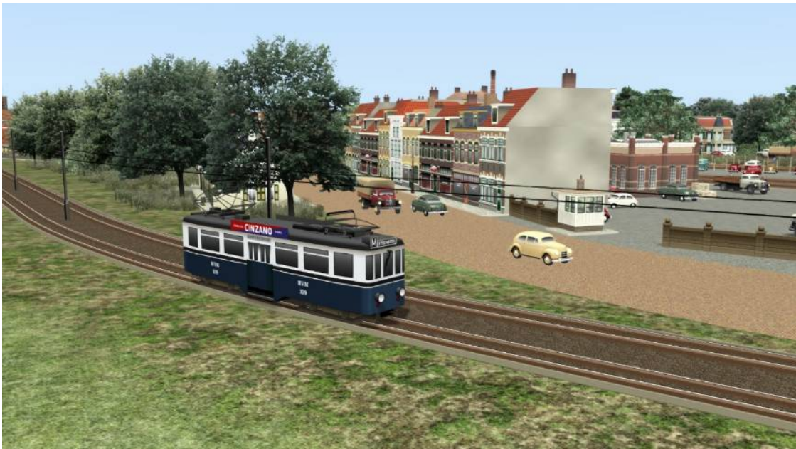
Interlokale tram aan de rand van Opleusden, het beginpunt van de VSTS-route.

Kijken we naar de schematische weergave van de VSTS dan zien we dat Opleusden aan het begin van het nog niet geëlektrificeerde gedeelte van de route is gedacht. Daar zullen dus een groot aantal scenario's kunnen starten, die met stoom- en dieseltractie kunnen worden uitgereden en in principe de hele route kunnen bestrijken. Een belangrijk onderdeel van het emplacement van Opleusden wordt gevormd door overgave- en opstelsporen. Die worden gebruikt voor de bediening van de Minerva-autofabriek, waar Volkswagens worden geassembleerd en die over een eigen aansluiting of 'raccordement' beschikt. Een ander opvallend kenmerk van Opleusden is de tram die net als het wegverkeer onderdeel is van de bewegende scenery.