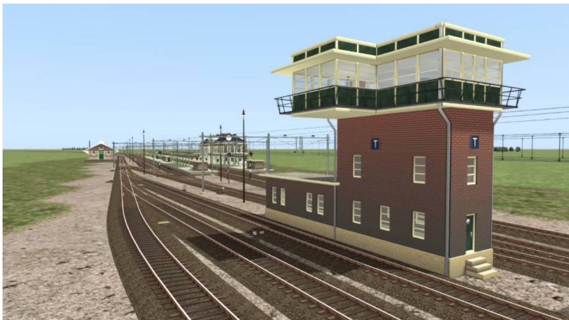
Werk in uitvoering: Emplacement Vriezenwaard, het eindpunt van de VSTS-route.

Inmiddels is de hier beschreven activiteit gevorderd tot even voorbij Steenbeek. De teller van de gecompleteerde scenery staat daarmee op ca. 35 procent. Er valt dus nog een hoop te doen, maar er komt een ogenblik dat we van het laatste station op de route de aangeklede versie kunnen publiceren. Maar voor het zover is: zo ziet het emplacement van Vriezenwaard er nu nog uit: