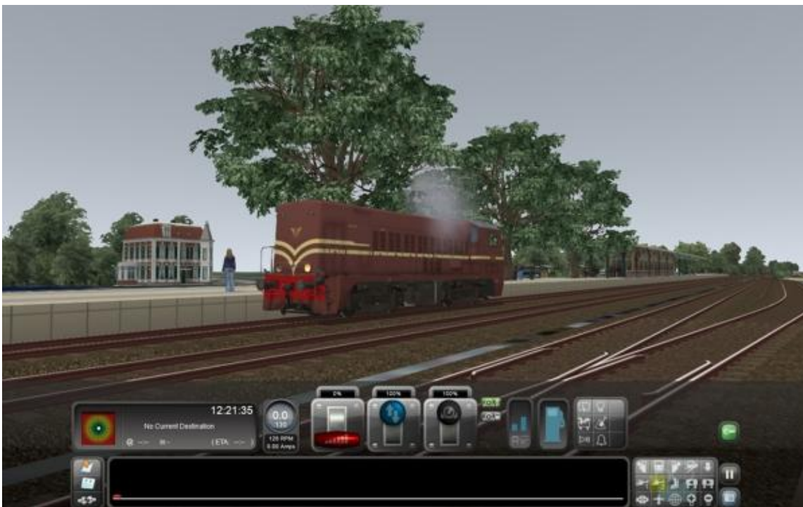
1 Prototype 2 is onder meer gebruikt om de trackrules te testen die speciaal voor de VSM-route werden ontwikkeld.

Al met al is er al veel werk verzet. Bovendien brengt Train Simulator 2014 een groot aantal verbeteringen met zich mee die het leven van route- en objectbouwers een stuk aangenaamer zullen maken. De komende maanden verwacht het OT daarom flinke voortgang te maken met de bouw van de VSM-route. Wij houden u op de hoogte en zodra er een releasedatum is vastgesteld zullen we die langs de gebruikelijke kanalen bekend maken.