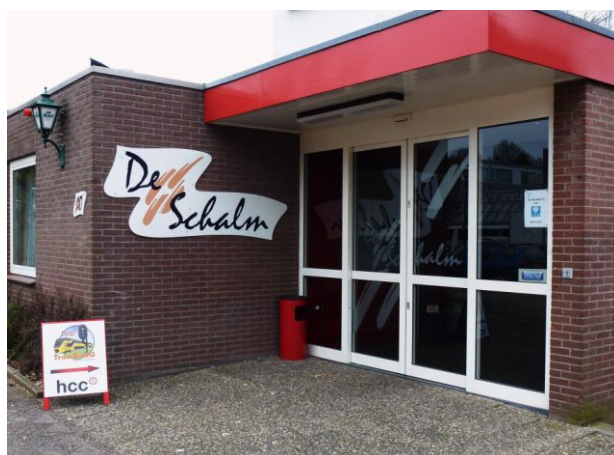
Oranjelaan 10, 3454 BT. De Meern (bij Utrecht)

Op 5 oktober (zaal 5 en 6), 9 november en 7 december.