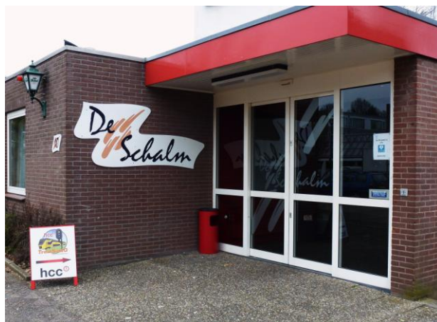
Oranjelaan 10, 3454 BT. De Meern (bij Utrecht)

Zie ook onze site met veel informatie: www.hcc-trainsimig.nl