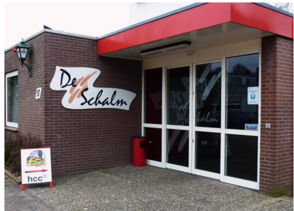
Oranjelaan 10, 3454 BT. De Meern (bij Utrecht)

Zie ook onze site met veel informatie: www.hcc-trainsimig.nl