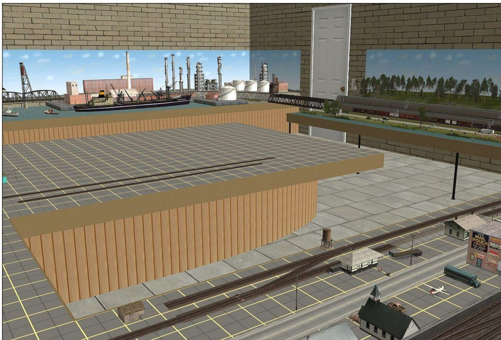
Een virtuele modelbaan (2).

De route is onmiskenbaar – ondanks de wat gedateerde wijze van shading van de objecten – een modelbaan geworden. De treinen en het landschap in de route worden door deze opzet gereduceerd tot miniatuurtreinen en tot een landschap van modelbaanformaat. Het voordeel: men is voor de virtuele modelbaan niet gebonden aan de omvang van een fysieke kamer, kelder of garage, de virtuele ruimte kan zo groot gemaakt worden als je wil. Bovendien wordt deze baan nooit stoffig en de baan hoeft nooit opgeruimd te worden. De charme van modelbanen is natuurlijk dat je met beperkte ruimte toch heel veel probeert te doen; het invullen van vele vierkante kilometers landschap zoals in een ‘echte’ route is niet nodig, wat veel tijd spaart. De leukste virtuele diorama’s ontstaan ook wanneer je met beperkte ruimte probeert een zo afwisselend mogelijk virtueel spoorbedrijf met scenery op te zetten.