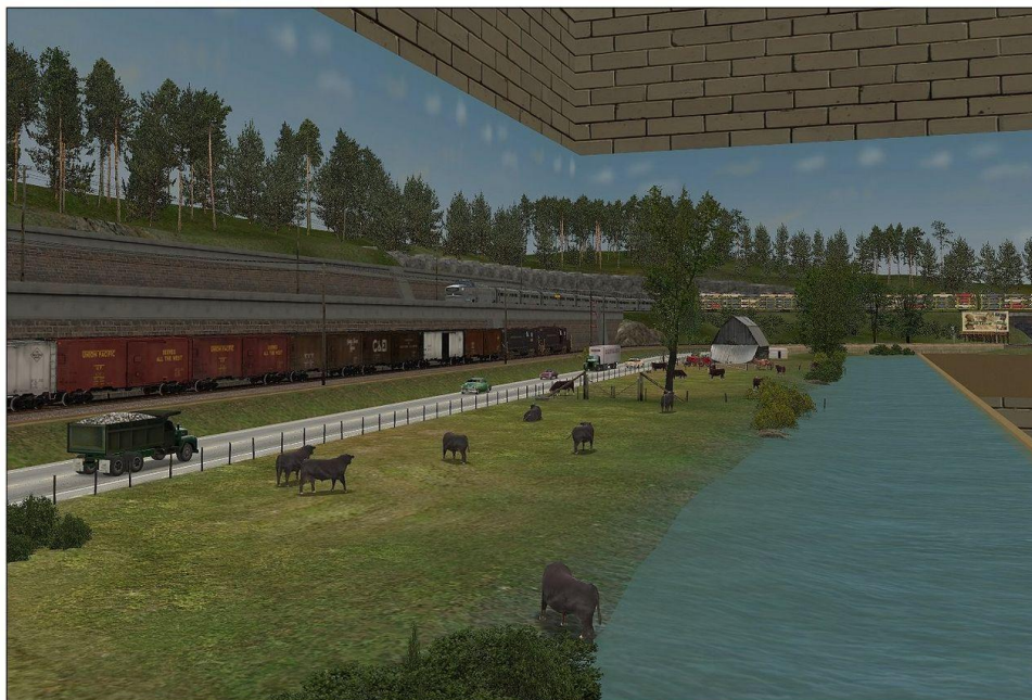
Een virtuele modelbaan (3).

In het weekend van 21 februari was de Trainsim IG op de Rail2014-beurs in Houten aanwezig en de modelbaan-setup van Trainz zou daar ongetwijfeld veel aandacht hebben getrokken, omdat deze beurs zich voornamelijk richt op modelbouwers. De screenshots zijn ontleend aan screenshots op het Auran forum, met dank aan de betreffende routebouwers. De huiselijke objecten van reuzenformaat en de kunstmatige tafelrand zijn naar men op het Auran-forum aangeeft te downloaden vanaf het Auran Download Station.