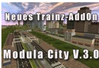
De tramroute Modula City V3.0